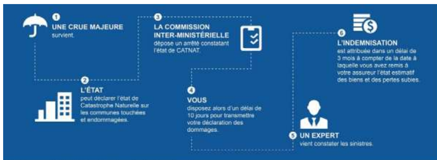
Cheminement de la déclaration de catastrophe naturelle

En cas de crue majeure, l'État peut déclarer l'état de Catastrophe Naturelle sur les communes touchées et endommagées. Après l'arrêté interministériel constatant l'état de CATNAT, vous disposez d'un délai de 10 jours pour transmettre votre déclaration des dommages.